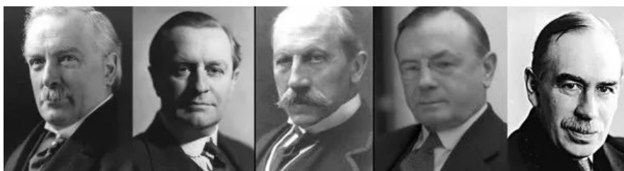
The Round Table Delegation Planning Versailles: From left to right: Lloyd George, Lord Lothian, Lord Milner, Leo Amery and Fabian leader John Maynard Keynes

anche la conferenza sulle riparazioni in Francia che, tra le altre cose, impose alla Germania sconfitta il rimborso di un debito impossibile e creò la Società delle Nazioni che doveva diventare lo strumento per un "ordine mondiale post-nazionale". Lloyd George guidò la delegazione britannica insieme al suo assistente Philip Kerr (Lord Lothian), Leo Amery, Lord Robert Cecil e Lord John Maynard Keynes, che avevano un programma a lungo termine per realizzare una dittatura globale. Tutti questi personaggi erano membri del nascente Movimento della Tavola Rotonda, che aveva preso il pieno controllo della Gran Bretagna spodestando Asquith nel 1916 [3] e che è al centro dell'odierno "Stato profondo".